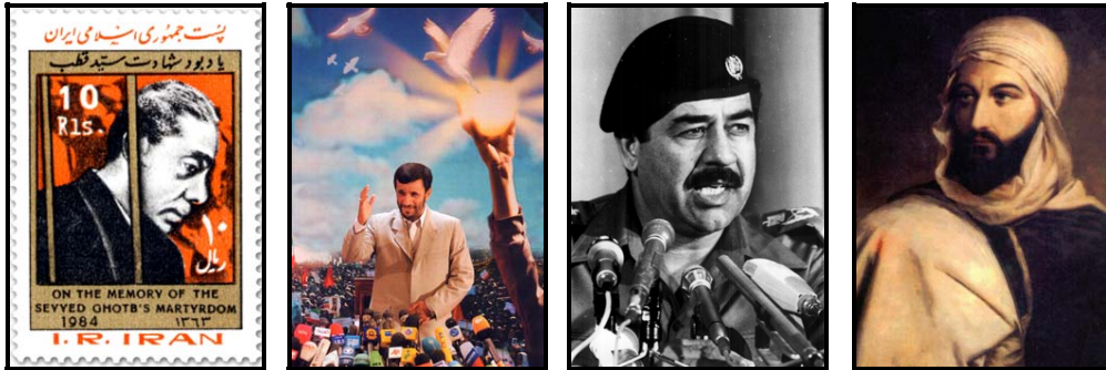
De gauche à droite, en haut : Imam Khomeyni (1902-1989) ; Mu'ammarr Kadhafi (1942-2011 † ) ; Oussama ben Laden (1957-2011 † ) ; Mehémet Ali (1769-1849) ; en bas : Sayyid Qutb (1906-1966 † ; ici sur un timbre iranien de 1984 !) ; Mahmoud Ahmadinejad (1956-...) ; Saddam Hussein (1937-2006 † ) ; Abd el-Kader (1808-1883). († = assassinés !)

Pan-arabisme et Pan-islamisme, Sunnites et Chiites, même Résistance Contre l'Occident Barbare/Païen !