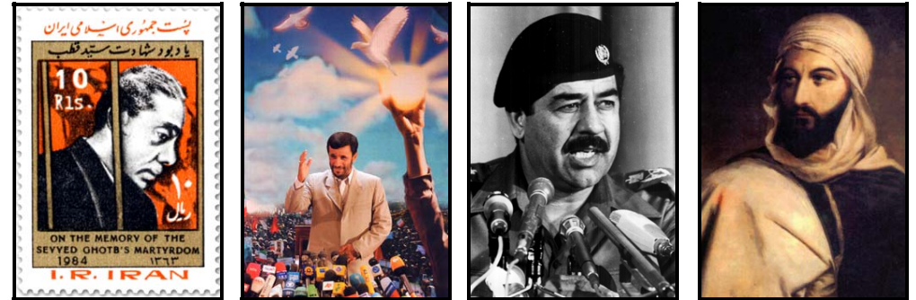
De gauche à droite, en haut : Imam Khomeyni (1902-1989) ; Mu'ammarr Kadhafi (1942-2011 † ) ; Oussama ben Laden (1957-2011 † ) ; Mehémet Ali (1769-1849) ; en bas : Sayyid Qutb (1906-1966 † ; ici sur un timbre iranien de 1984 !) ; Mahmoud Ahmadinejad (1956-...) ; Saddam Hussein (1937-2006 † ) ; Abd el-Kader (1808-1883). († = assassinés !)

Pan-arabisme et Pan-islamisme, Sunnites et Chiites, même Résistance Contre l'Occident Barbare/Païen !